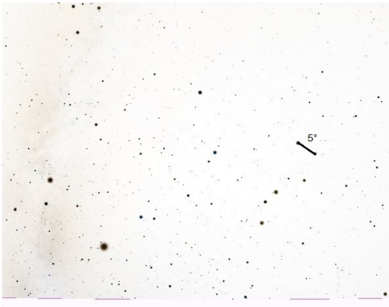
Рис. 1: Вид звездного А

течении одной ночи. Виды представляют собой негативы изображений, т.е. свет- лое показано темным, а темное светлым. Линия горизонта проходит по нижнему краю каждого снимка.