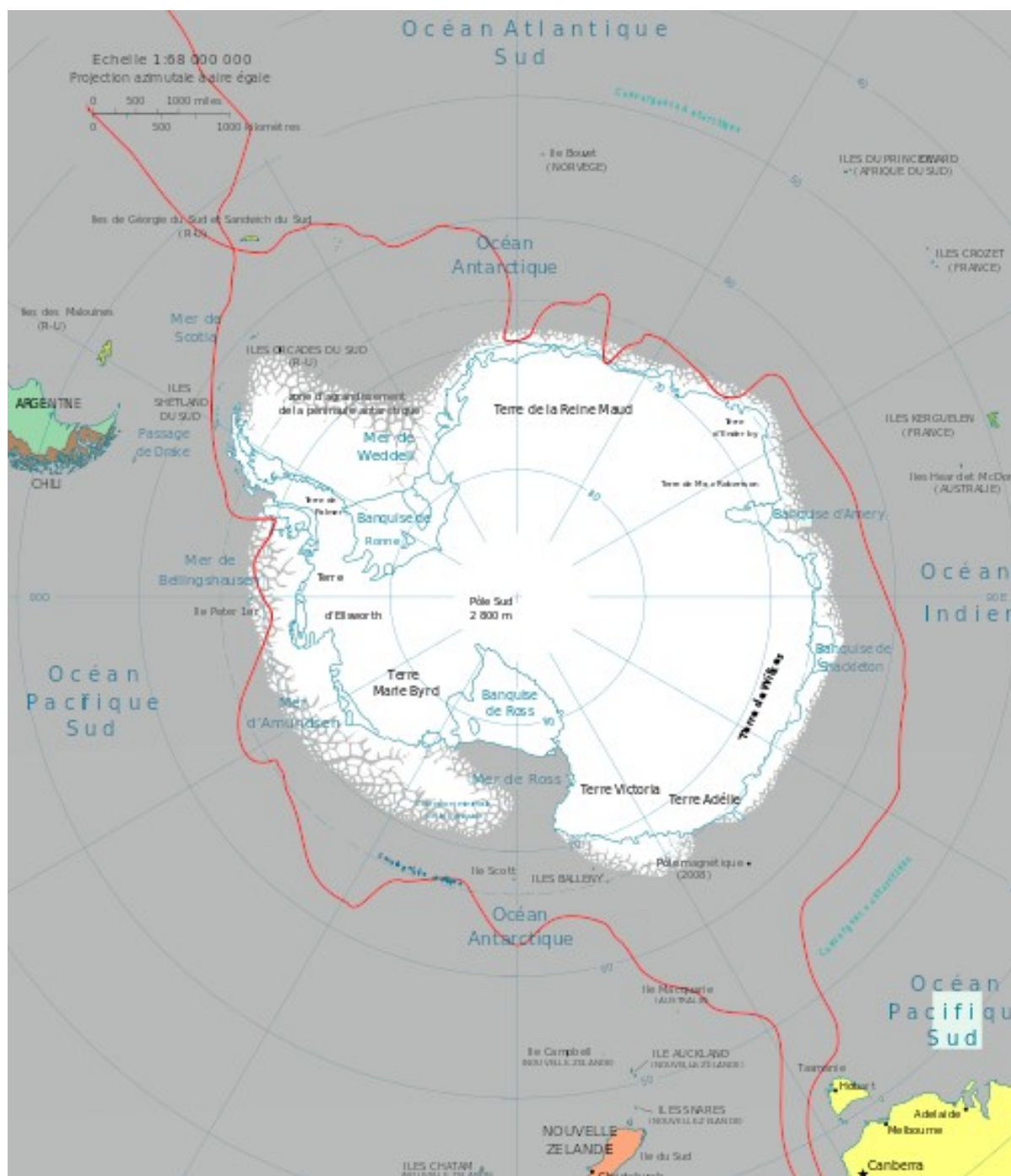
Рис. 1: К задаче «Экспедиция Лазарева-Беллинсгаузена». Схема пути экспедиции