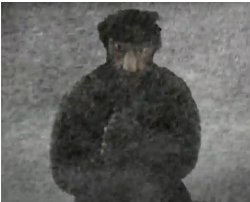
Рис.5. – Кадр из мультфильма «Капитанская дочка». Режиссер – Е. Михайлова, 2005.

Задание будет оценено по четырёх критериям :