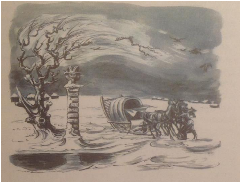
Рис.2. – В. Милашевский. Иллюстрация к повести «Метель»