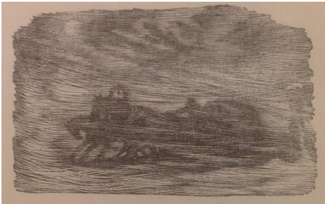
Рис.3. – Ф. Константинов. Иллюстрация к стихотворению «Бесы»