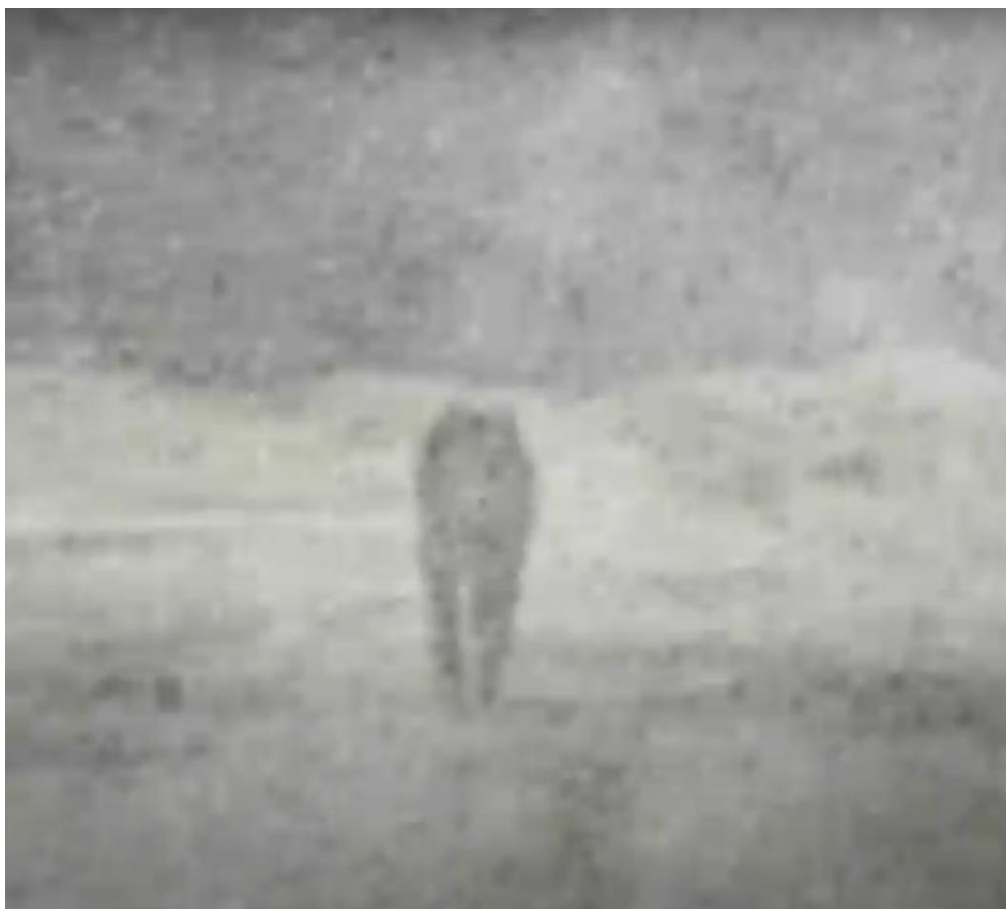
Рис.4. – Кадр из мультфильма «Капитанская дочка». Режиссер – Е. Михайлова, 2005.